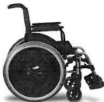
Modelo para cadeira dobrável.